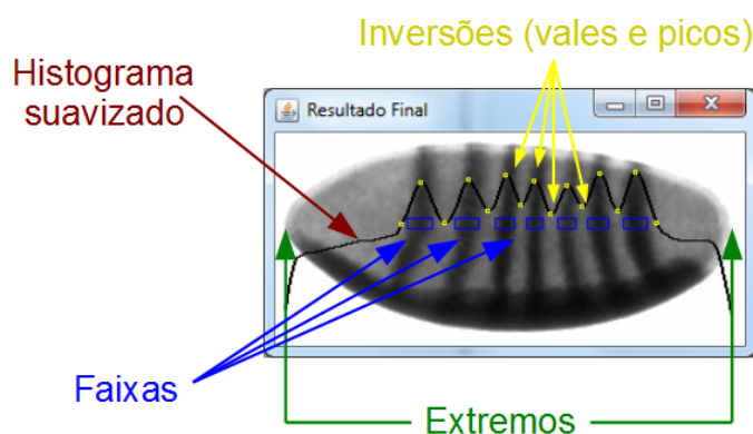
Figura 1. Indicação dos conceitos utilizados na ferramenta

A Figura 1 ilustra os conceitos utilizados no algoritmo em uma imagem real na qual há sete faixas transversais.