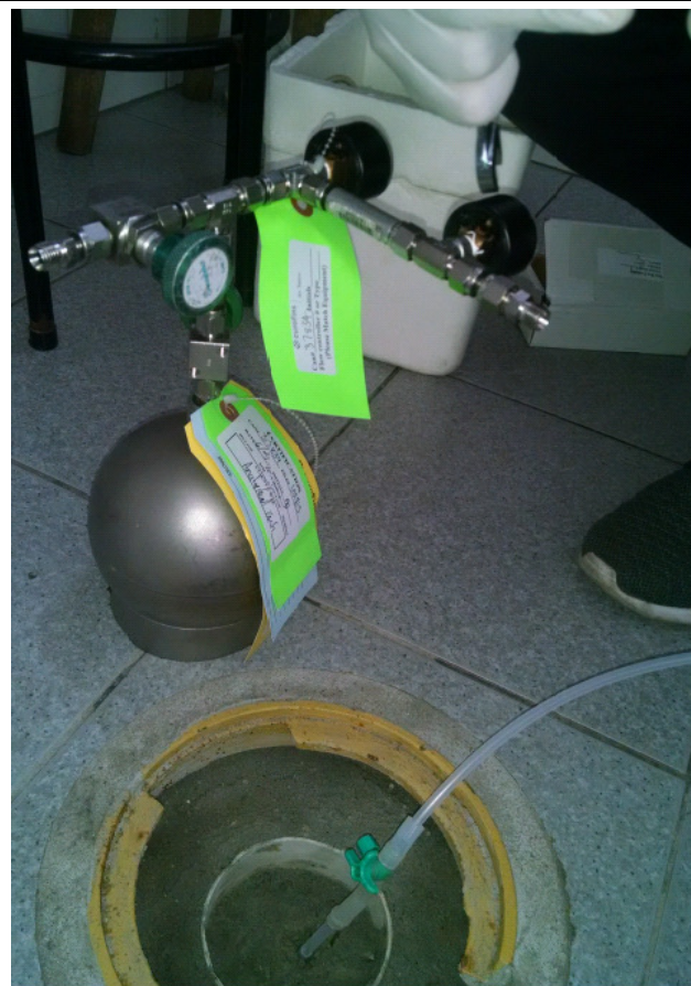
Foto 04: Coleta de amostra de gás utilizando canister - poço de monitoramento de gás instalado na área de transporte.