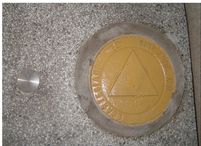
Foto 02: Poço de monitoramento de gás recém-instalado – Transporte.