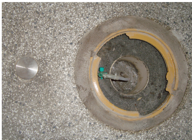
Foto 01: Poço de monitoramento de gás recém-instalado – Guarda Universitária.

Abaixo, são apresentadas fotos que ilustram as atividades conduzidas em julho de 2015: