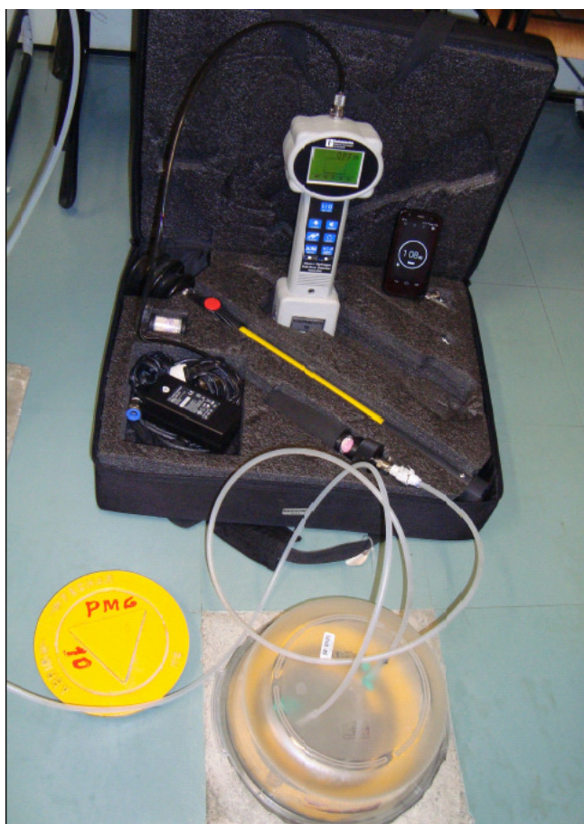
Foto 03: Teste de estanqueidade - poço de monitoramento de gás PMG-10B.